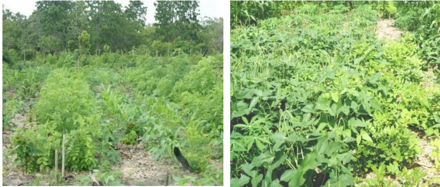
Figura 3 - Consórcios milho + feijão e mandioca + feijão com uso da bagana em condições do litoral norte do Ceará, sob estresse hídrico. Bela Cruz, 2013

45,92%, as médias se elevaram de 25,2 sem uso bagana para 46,6 com uso da bagana. O número de grãos/planta foi de 112 grãos sem uso de bagana para 206 com uso da bagana mostrando superioridade ( P < 0,05 ) de 45,63% (Tabela 3).