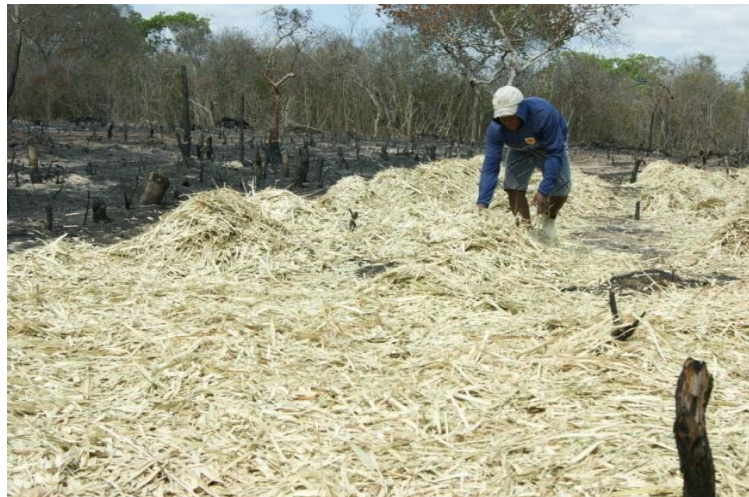
Figura 2 - Aplicação da bagana de carnaúba na área. Bela Cruz, 2013